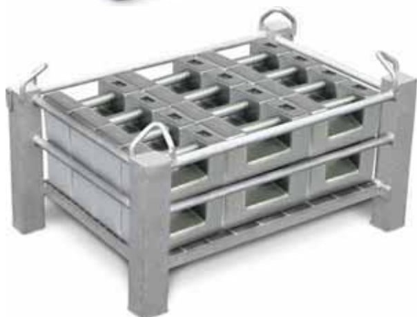
"WBX20500" massa campione porta-pesi