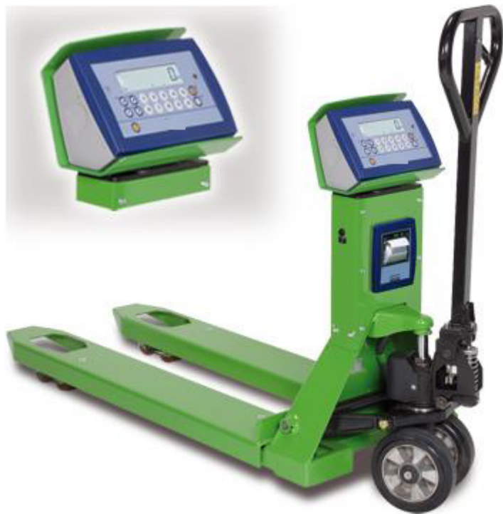
TPW con stampante opzionale