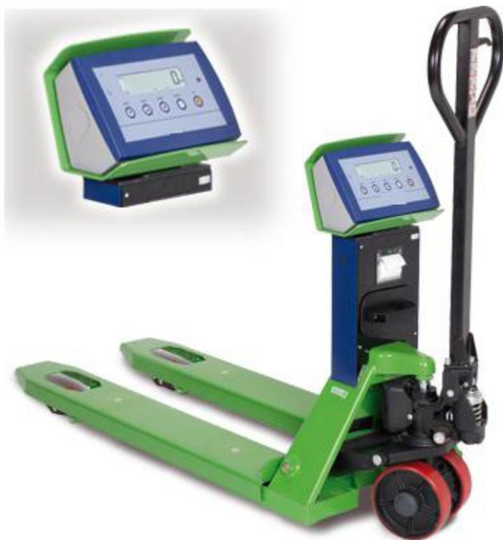
TPWA con stampante opzionale